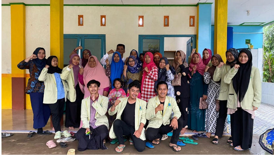
Gambar 5. Kegiatan foto bersama kelompok pengabdian Kuliah Kerja Nyata UIN Salatiga bersama anggota Kelompok Wanita Tani Dusun Kalikebo, Desa Rejosari, Kecamatan Bandongan, Kabupaten Magelang

materi yang sudah dipaparkan. Disini masih terlihat ada beberapa anggota yang bingung akan takaran bibit sehingga menuangkan bibit yang terlalu banyak atau terlalu sedikit. Dipraktekkan pula cara perawatan tanamannya dan berapa kira-kira debit air yang dibutuhkan untuk merawat sayur-sayuran ini.