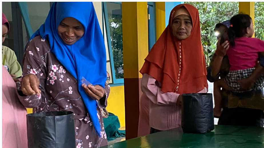
Gambar 4. Sesi Menanam Benih

Kelompok mahasiswa membagikan lima bibit tanaman yakni kangkung, seledri, sawi, selada, dan bayam secara merata kepada peserta yang hadir. Dibagikan pula lima polybag untuk setiap peserta. Peserta diperkenankan bertanya dan dijawab oleh pemateri. Peserta bertanya berapa kira-kira bibit yang bisa disebar dalam satu polybag dan dijawab oleh pemateri sekiranya tidak terlalu banyak maupun terlalu sedikit, hal ini dilakukan supaya pertumbuhan sayuran lebih maksimal. Tidak ada takaran pasti dalam penyebaran benih sayuran namun kita dapat memperkirakan jarak penyebaran benih yang pas. Disini pemateri menekankan akan manfaat yang dapat diambil dari menanam tanaman ini dan mempersilahkan peserta untuk mencoba menanamnya di pelataran rumah masing-masing.