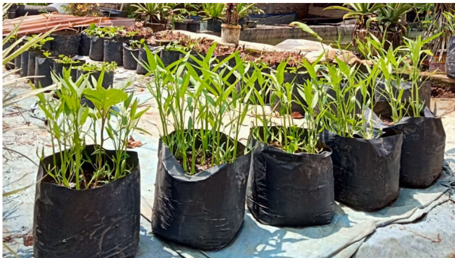
Gambar 6. Hasil Kegiatan Penanaman Sayuran Di Pekarangan

Foto ini diambil dari halaman rumah warga yang sudah mempraktikkan kegiatan penanaman sayur di halaman. Penanam memberikan komentar bahwa dengan menanam sayur sendiri bisa lebih mengurangi pengeluaran belanja. Selain itu sayur hasil sendiri memiliki rasa yang lebih segar ketika dihidangkan.