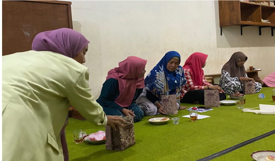
Gambar 3. Pemberian Bibit Sayuran

Kelompok mahasiswa membagikan lima bibit tanaman yakni kangkung, seledri, sawi, selada, dan bayam secara merata kepada peserta yang hadir. Dibagikan pula lima polybag untuk setiap peserta. Peserta diperkenankan bertanya dan dijawab oleh pemateri. Peserta bertanya berapa kira-kira bibit yang bisa disebar dalam satu polybag dan dijawab oleh pemateri sekiranya tidak terlalu banyak maupun terlalu sedikit, hal ini dilakukan supaya pertumbuhan sayuran lebih maksimal. Tidak ada takaran pasti dalam penyebaran benih sayuran namun kita dapat memperkirakan jarak penyebaran benih yang pas. Disini pemateri menekankan akan manfaat yang dapat diambil dari menanam tanaman ini dan mempersilahkan peserta untuk mencoba menanamnya di pelataran rumah masing-masing.