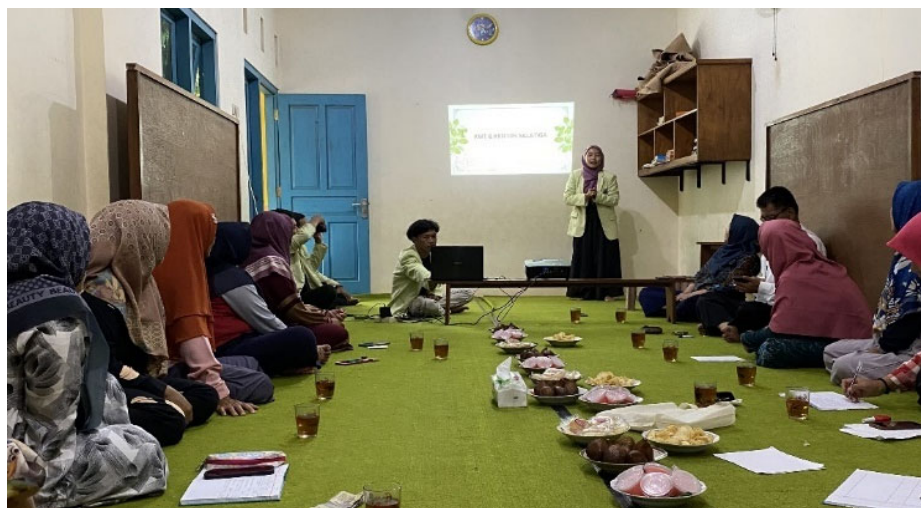
Gambar 2. Sesi Pemaparan Materi