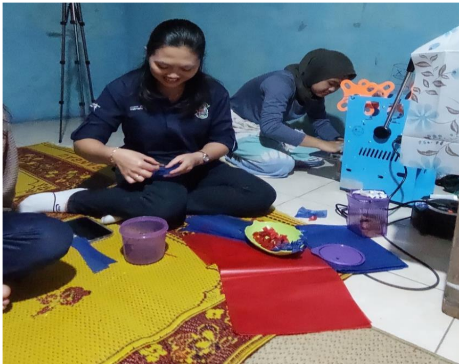
Gambar 8. Pengemasan permen susu

Rincian biaya pembuatan permen susu dapat dihitung sebagai berikut: