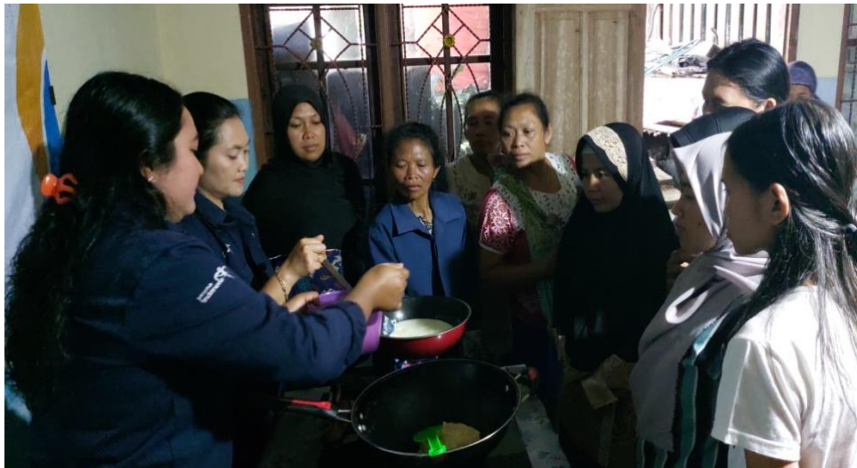
Gambar 6. Proses memasak susu

Proses pembuatan permen susu memerlukan waktu 2 hingga 3 jam untuk mendapatkan permen susu yang bertekstur kenyal (tidak lembek tapi juga tidak keras) dan memiliki masa simpan yang lebih lama (1 hingga 3 bulan). Bahan baku yang dibutuhkan untuk membuat permen susu pun cukup sederhana dan mudah ditemukan di warung sekitar rumah.