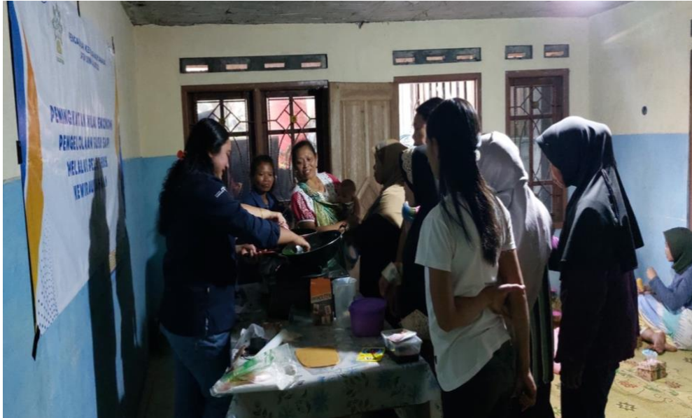
Gambar 14. Antusiasme Peserta Pelatihan

mungkin sudah menghindari susu karena kandungan lemaknya yang tinggi dapat mengonsumsi yogurt yang terkenal baik bagi pencernaan.