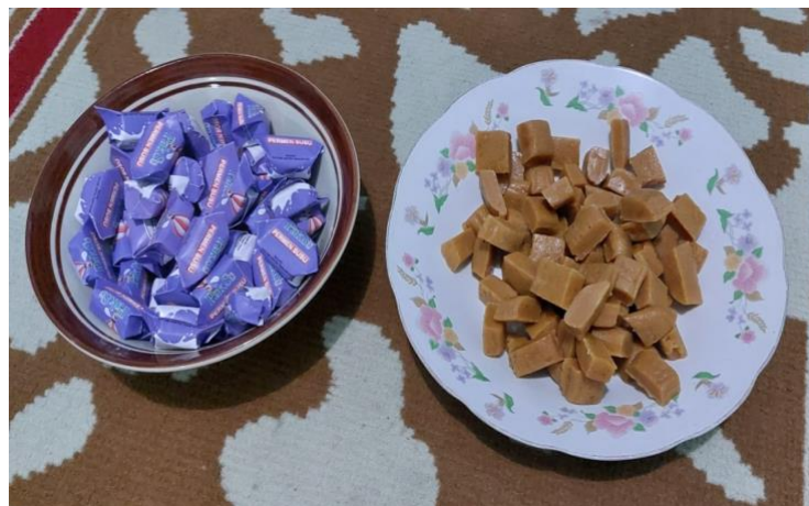
Gambar 9. Kemasan Permen Susu

Kemasan yang bagus tentu akan lebih menarik minat konsumen untuk membeli suatu produk apalagi bagi anak-anak, sehingga produsen harus memerhatikan kemasan produknya. Tidak hanya masalah kemasan saja, tetapi Pokdarwis juga membantu dalam pengurusan sertifikat izin Pangan Industri Rumah Tangga (PIRT). PIRT sangat dibutuhkan bagi produsen untuk dapat memasarkan produknya lebih luas seperti pusat oleh-oleh, supermarket atau mini market dan