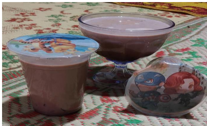
Gambar 11. Pembuatan Susu Jelly