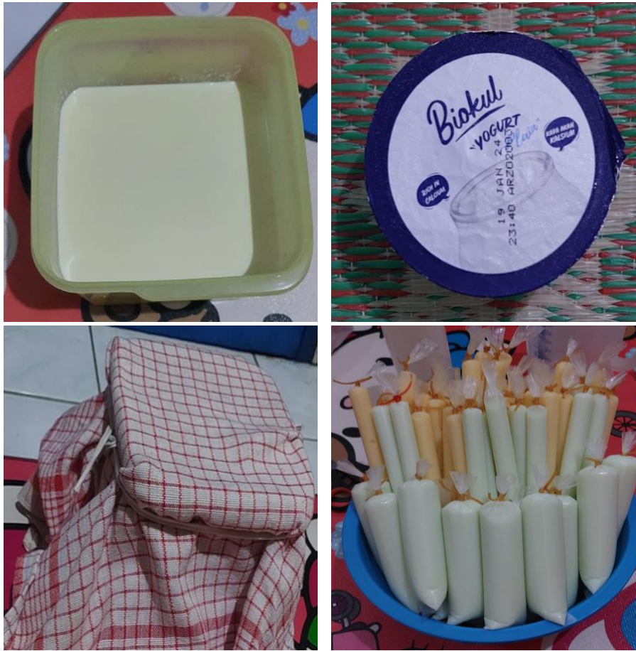
Gambar 12. Proses pembuatan yoghurt