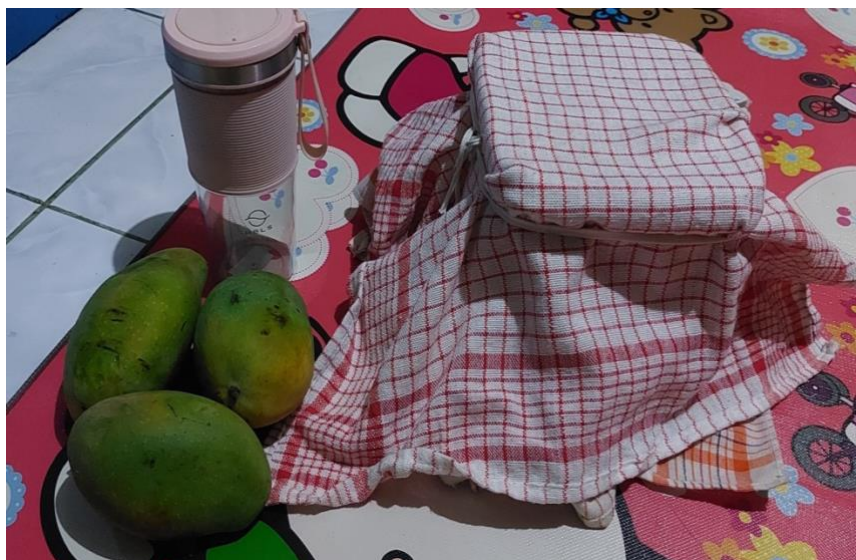
Gambar 13. Penambahan buah sebagai perasa alami