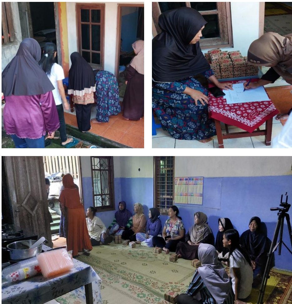
Gambar 15. Peserta Pelatihan

Evaluasi ini lebih ditekankan pada penambahan wawasan pengetahuan dari peserta pelatihan. Semua peserta pelatihan memberikan testimoni positif karena kegiatan pelatihan ini memberikan pengetahuan dan pengalaman yang baru bagi ibu-ibu tentang pengolahan susu. Banyak yang pernah atau sering mengonsumsi olahan susu tetapi untuk proses pembuatan masih sangat awam. Berbagai informasi tentang harga jual dan juga saluran untuk memasarkan produk juga sangat bermanfaat sehingga jika ingin menjadi produsen olahan susu sudah sangat terbantu dengan beragam fasilitas yang telah disediakan oleh pemerintah Desa Sumogawe. Selain itu, peserta juga mengharapkan adanya kegiatan lanjutan seperti pengolahan susu sapi menjadi aneka camilan.