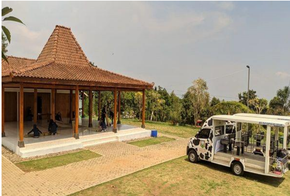
Gambar 2. Pendopo dan mobil suttle di Sumogawe Valley

Pada dasarnya, desa wisata kampung susu Sumogawe tidak hanya meningkatkan potensi wisata saja. Akan tetapi, dengan adanya kampung susu ini, diharapkan dapat meningkatkan nilai ekonomi susu perah warga desa Sumogawe. Jika petani menjual susu sapi segar seharga Rp. 5.900 sampai Rp.6.300 per liter maka melalui pengelolaan UMKM para petani susu bisa meningkatkan nilai ekonomi susu sapi dengan melakukan pengolahan menjadi produk-produk yang memiliki harga jual yang lebih tinggi.