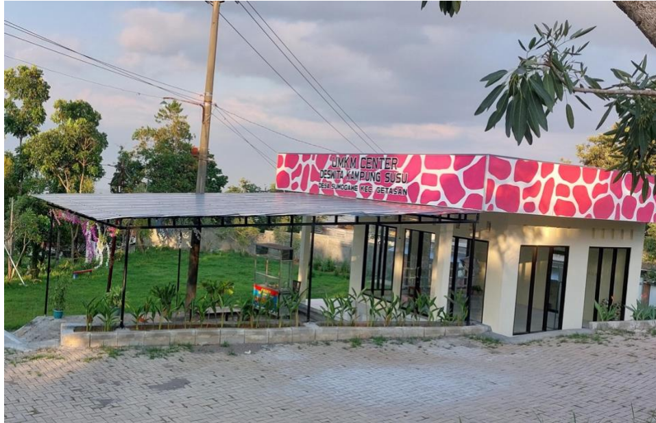
Gambar 4. Galeri UMKM Centre

olahan geplak waluh, pia waluh, aneka macam rempeyek, keripik, kerupuk, dan camilan asil olahan warga.