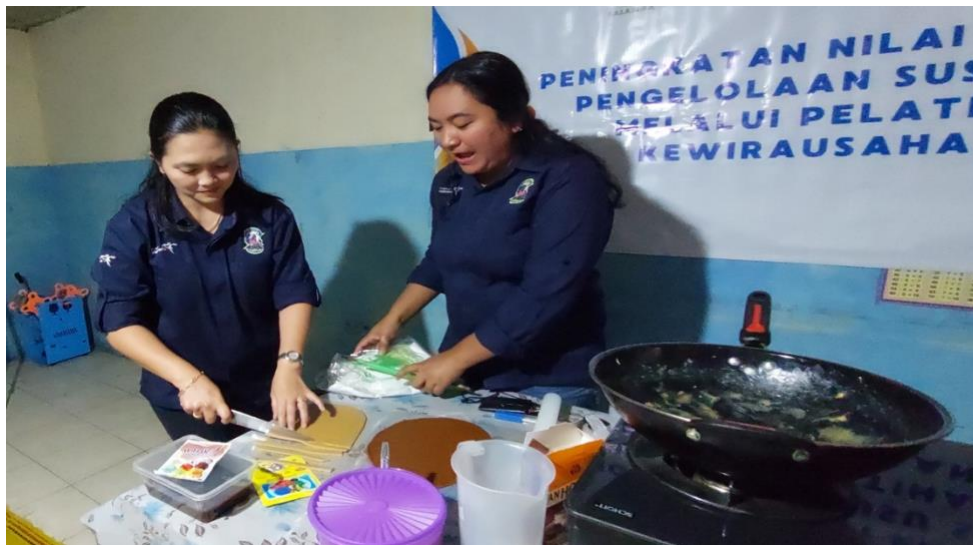
Gambar 7. Proses memotong permen susu