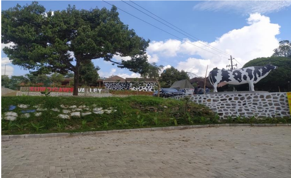
Gambar 1. Sumogawe Valley

dalam pengelolaan UMKM diantaranya adalah mengubah cara berpikir warga sadar kepariwisataan.