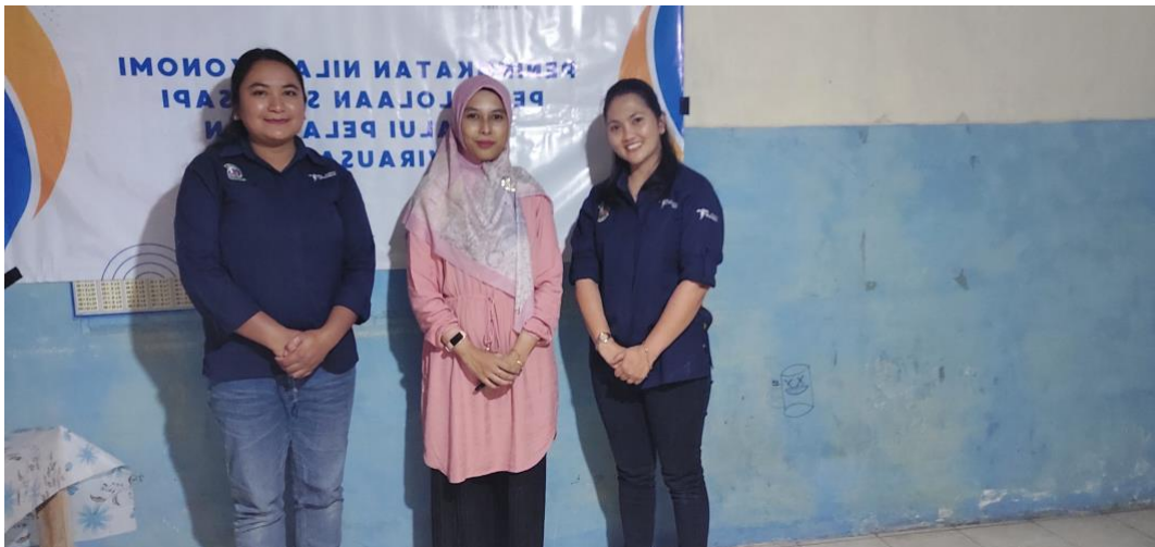
Gambar 16. Pelaksanaan Kegiatan