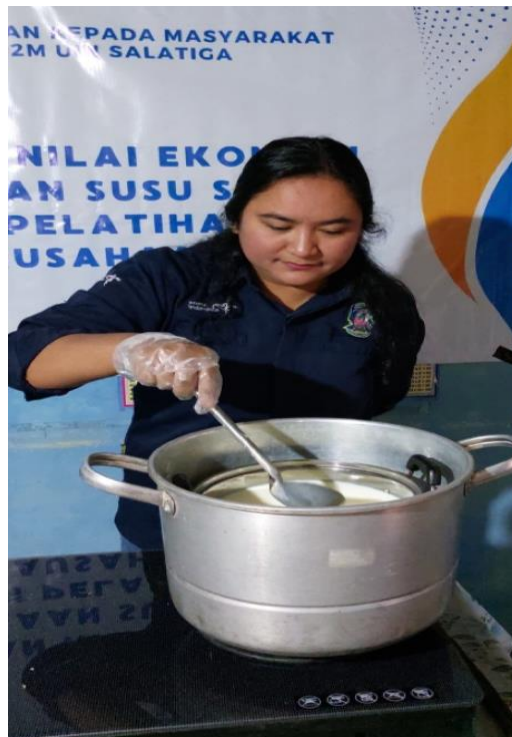
Gambar 10. Proses menghangatkan susu

Susu jelly merupakan produk olahan susu menjadi minuman yang banyak digemari anak-anak dan remaja. Susu jelly berbahan dasar susu sapi segar dengan divariasikan berbagai varian rasa dan penambahan jelly untuk memberikan rasa yang lebih unik. Susu jelly banyak dijajakan di sekolah-sekolah maupun pusat keramaian seperti alun-alun atau tempat perbelanjaan. Pembuatan susu jelly jauh lebih cepat dan mudah dengan bahan baku yang juga sampel dan mudah didapat. Pengolahan susu jelly yang baik diolah dengan metode pasteurisasi atau di steam sehingga kandungan nutrisi susu tetap terjaga. Proses memasak susu untuk pembuatan susu jelly dan yogurt sama sehingga sekali memanaskan susu dapat digunakan untuk membuat kedua olahan tersebut.